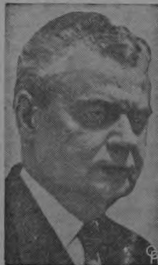
DIEFENBAKER irada actitud frente a Estados Unidos...

OTTAWA, 31 (AP) — El primer ministro John Diefenbaker dijo esta noche que la declaración del Departamento de Estado emitida la víspera, en la cual se critica el fracaso en armarse con armas atómicas "constituye una intromisión injustificada" en los asuntos canadienses.