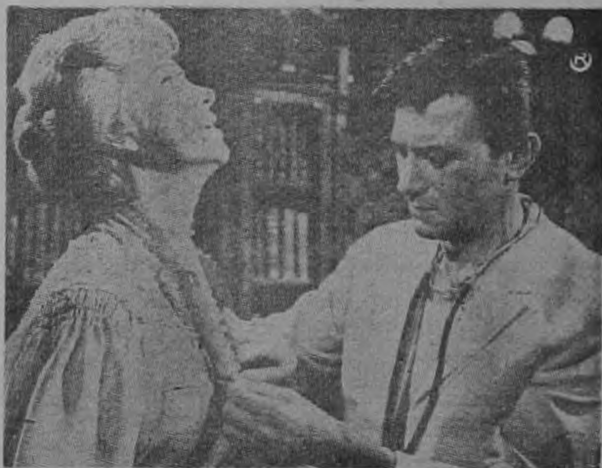
Laurence Harvey, como el joven médico, parrandero y disoluto, desabrocha la blusa para así auscultar mejor a su paciente: Geraldine Page, que hace el papel de una solterona de frenéticas pasiones reprimidas, y que se enamora de su doctor. La tórrida escena es muy expresiva al respecto. La verán en "VERANO Y HUMO".

Geraldine Page, la nueva radiante estrella del firmamento de Hollywood, se ha posesionado íntimamente del personaje que interpreta en la superproducción Paramount "VERANO Y HUMO".