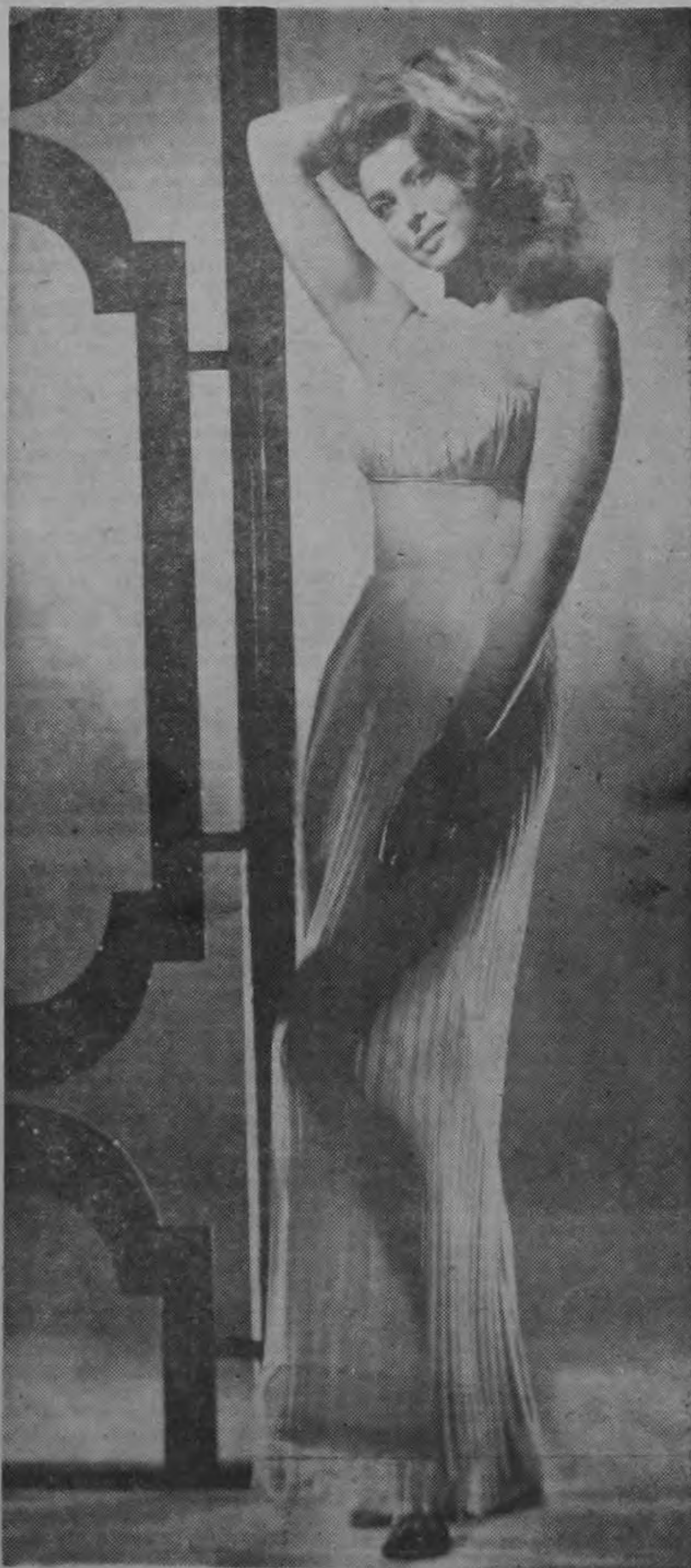
Bellísima foto de la conocida estrella de cine norteamericano: TINA LOUISE. Su película más recientemente exhibida en Costa Rica fue "El escuadrón blindado". Además de muchos cintas con papeles de segundo plano, la hermosa rubia Louise tuvo magnífica actuación en la excelente película "El Pequeño Acre de Dios".