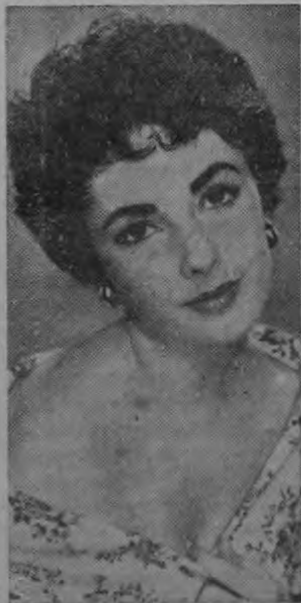
Doña Elizabeth... Sybil Burton no le teme...

Las escapadas de Burton con la Taylor provocó rumores de que existía un romance entre los dos mientras estaban filmando la película "Cleopatra" en Roma, el año pasado. La Taylor desempeñó el rol de Cleopatra en la cinta y Burton el de Marco Antonio.