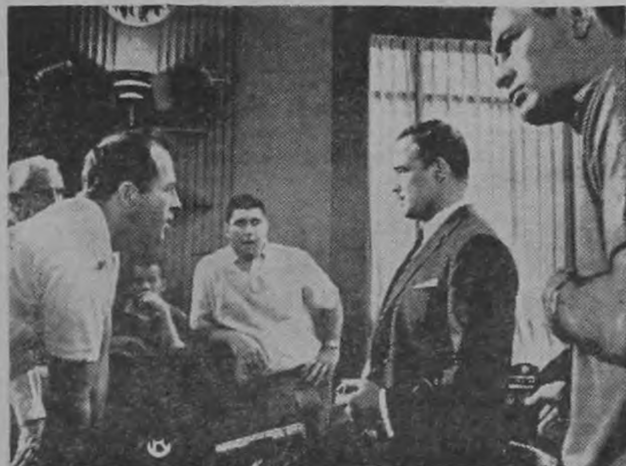
De acuerdo con su papel de Embajador de los Estados Unidos, Marlon Brando aparece siempre impecablemente vestido en la cinta "El Buen Americano". Su refinada elegancia es evidente en esta foto, donde lo acompañan otros excelentes ejemplares del sexo masculino... Salud, amigas lectoras.

En "La Bandida", María Félix más audaz que nunca se atreve hasta cantar, y para ser sinceros lo hace bien.