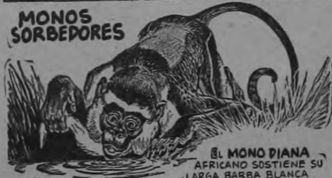
EL MONO DIANA AFRICANO SOSTIENE SU LARGA BARBA BLANCA MIENTRAS BEBE PARA NO MOJARSELA.

EL SAKÍ NEGRO SUDAMERICANO SE LLEVA EL AGUA A LA BOCA EN LA MANO PARA PROTEGER SU BARBA.