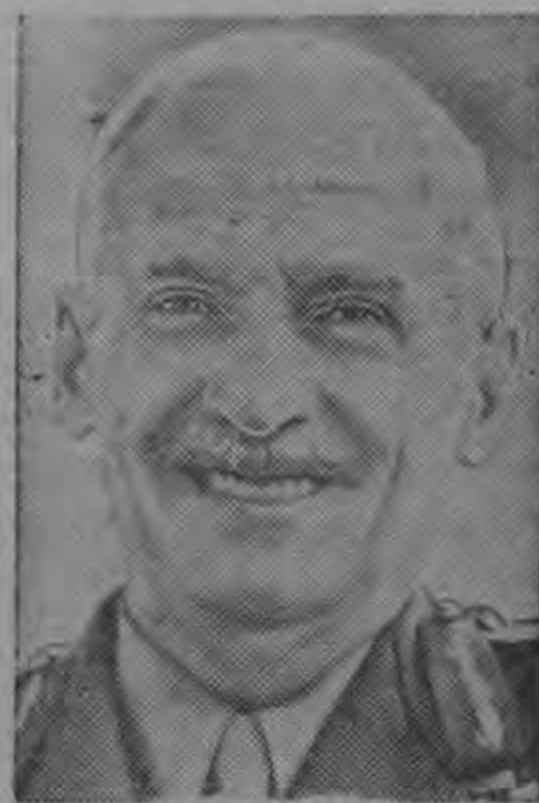
MONTGOMERY ....el viejo mariscal junto al héroe francés...

CIUDAD DEL CABO, 31 (AP) — El Mariscal retirado británico Bernard Montgomery llegó aquí hoy en su segunda visita a Sud Africa en un año, y dijo a los periodistas "me complace que el Reino Unido no haya ingresado al Mercado Común Europeo."