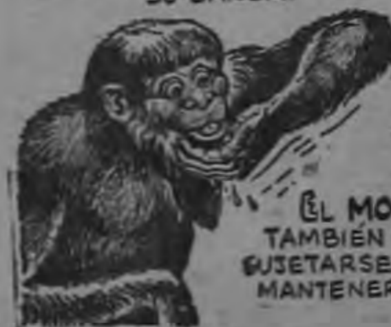
EL MONO NARIGÓN DE BORNEO TAMBIÉN TIENE BARBA, PERO PREFERE SUJETARSE LA COLGANTE NARIZ PARA MANTENERLA SECA AL BEBER.

EL SAKÍ NEGRO SUDAMERICANO SE LLEVA EL AGUA A LA BOCA EN LA MANO PARA PROTEGER SU BARBA.